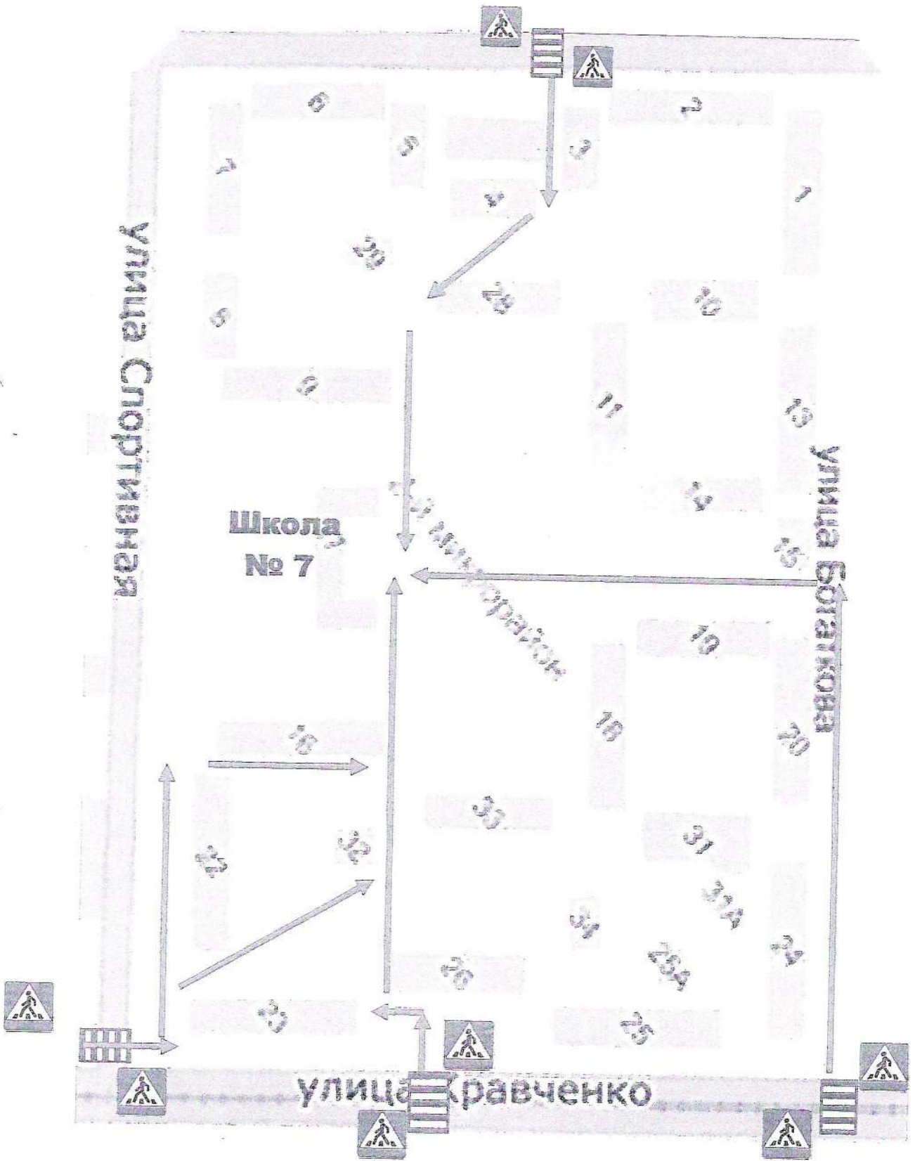
СХЕМА безопасного маршрута

Направление безопасного движения группы детей к стадиону